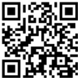
Рис. 3 – Ссылка на вебинар.

Этап № 3. Доведение до педагогов, ответственных за реализацию курса, сведений организационного характера. С данной целью в мае 2023 года проведен установочный вебинар (см. рисунок 3), а также от Минобразования Ростовской области направлено информационное письмо о внедрении программы медиаграмотности руководителям органов муниципального самоуправления, осуществляющих управление в сфере образования.