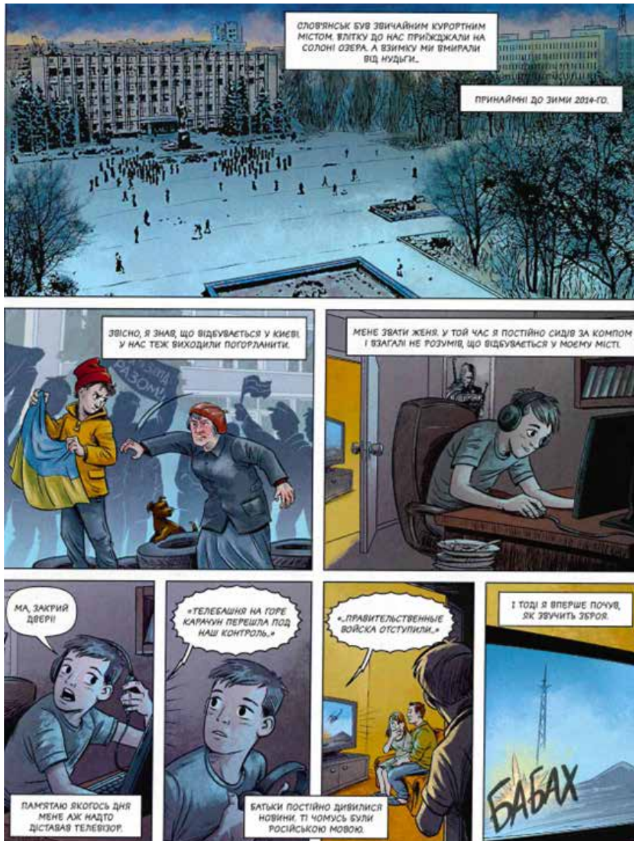
Рис. 1 – Фрагмент проукраїнського комікса «Звуки мира».

выступают представители исторического и экспертного сообществ националистического толка. Все материалы украиноязычные, русский язык используется крайне редко;