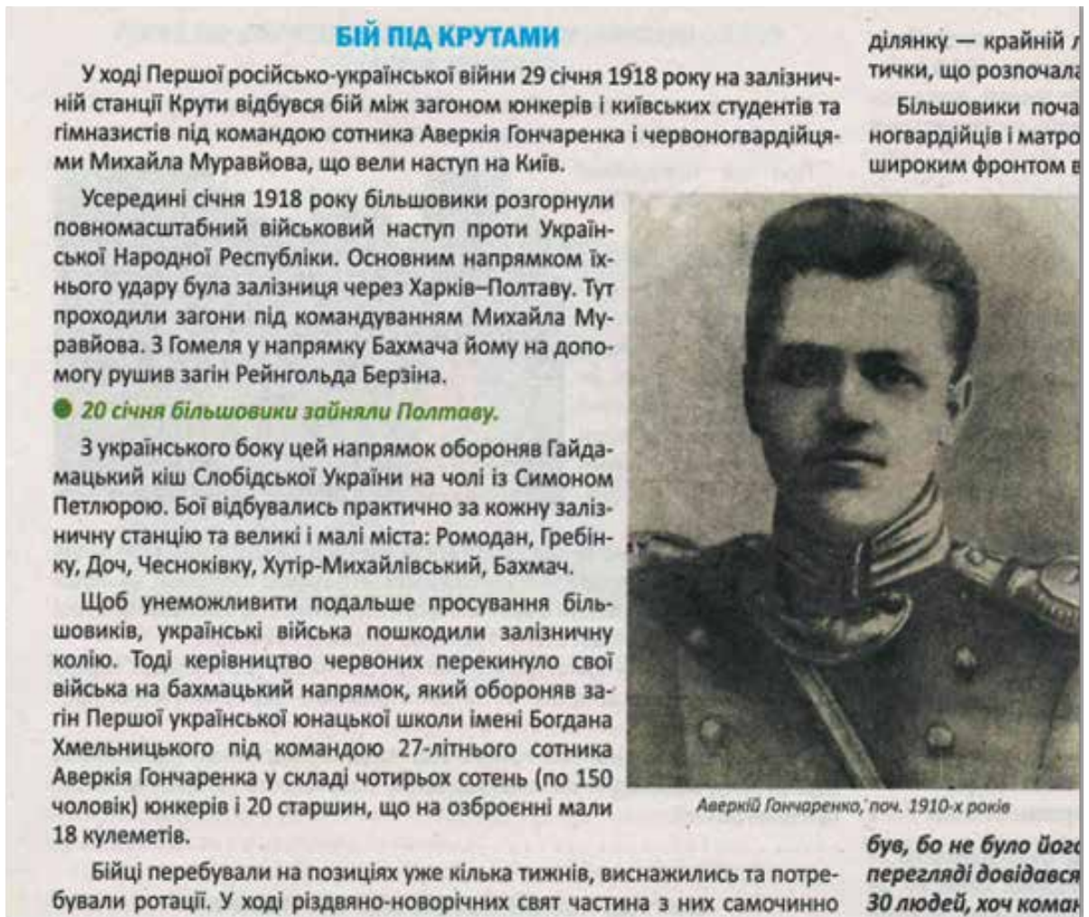
Рис. 3 – Бой под Крутами, как пример мифологизации «российско-украинских войн» в проукраинской газете «Патриот Донбасса».

1. «Украинский народ — жертва многовековой агрессии со стороны России вне зависимости от политического режима в Москве. Украинцы со времен Переяславской рады 1654 года постоянно боролись за независимость от Москвы».