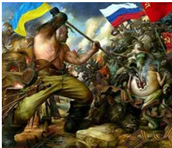
Рис. 6 – Пример украинского националистического плаката с русофобским содержанием.

Полная версия интервью с Александром Кибовским.