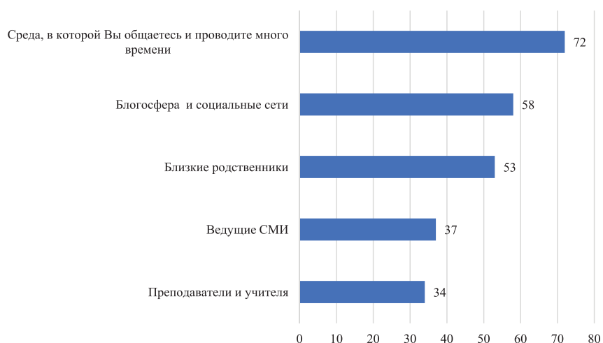
Рисунок 4. Кто, по Вашему мнению, повлиял на формирование Ваших политических взглядов?,%

а также блогосфера и социальные сети. При этом государство в лице ведущих СМИ, преподавателей и учителей имеет меньшее влияние на формирование мировоззрения молодых людей (см. рис. 4).