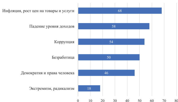
Рисунок 1. Какие проблемы общественной жизни Вас беспокоят в настоящее время больше всего?, %

Молодежь ощущает свою невостребованность на региональном рынке труда, не находит возможности реализовать свой творческий и образовательный потенциал, что приводит к миграции наиболее талантливых и образованных молодых людей в другие регионы страны и повышает вероятность перерастания социальной неудовлетворенности в протестные настроения.