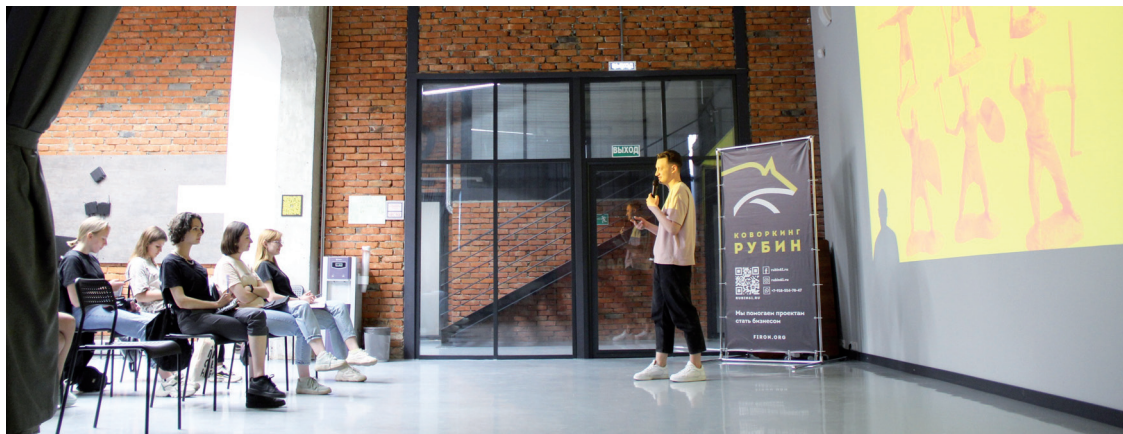
Рисунок 2. Лекция проекта в рамках образовательной программы

2. Сформировать у представителей студенческих медиаобществ основы создания медиаконтента, в частности, социально ориентированного.