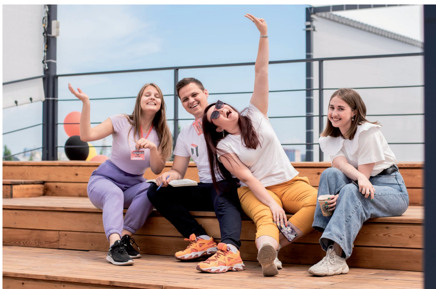
Рисунок 3. Участники проекта

Отдельно стоит отметить и тот факт, что проект поддержало много коммерческих организаций, выступивших спонсорами и экспертами отдельных мероприятий: Альфа-Банк, сеть пиццерий «Додо Пицца», Red Bull, дизайн-студия YUMMY interior, digital-агентство Романа Володина, маркетинговое агентство Gambit Media Agency, что подчёркивает актуальность на социальную тематику и в среде классического интернет-маркетинга, а также запрос на формирование