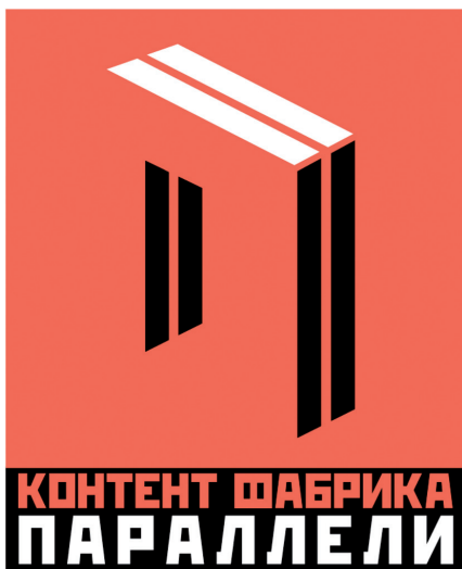
Рисунок 1. Логотип проекта «Контент-фабрика «Параллели»

1. Привлечь общественное внимание к проблеме создания и распространения социального профилактического медиаконтента.