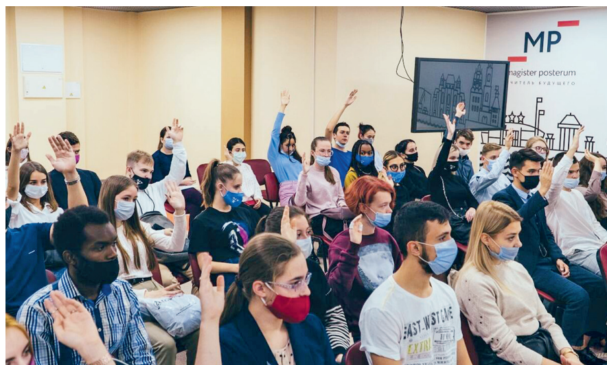
Рисунок 2. Мероприятие «Диалог культур»

Например, организация дискуссионной площадки для студентов первого курса на базе Астраханского государственного университета на тему «Диалог культур. Особенности профилактики экстремизма и терроризма в молодежной среде», в которой приняли участие 50 обучающихся, включая иностранных граждан. На дискуссионной площадке представители региональной власти рассказали молодым людям о случаях вовлечения их ровесников в противоправную деятельность и об ответственности, которую они понесли за это (см. рис. 2).